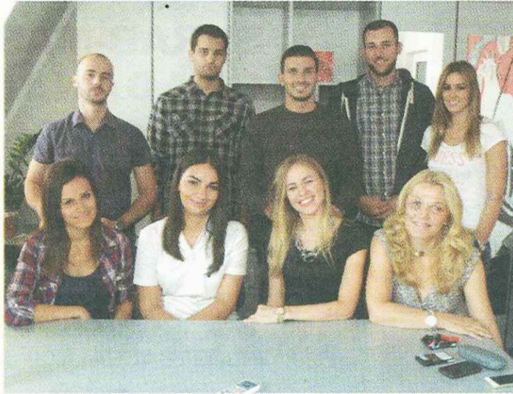
ПРВА ГЕНЕРАЦИЈА У УЧИОНИЦИ

Факултет медицинских наука одшколовао прву генерацију стоматолога. Мали број студената, квалитетна теоријска и практична настава и турски рад су оно на чему се на интегрисаним студијама стоматологије инсистира